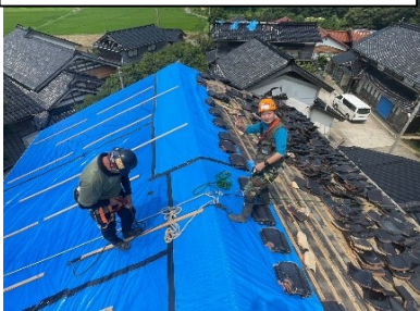
棟瓦を境に双方で確保を取って作業