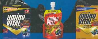
アミノバイタル プロ アミノバイタル パーフェクトエネルギー アミノバイタル GOLD